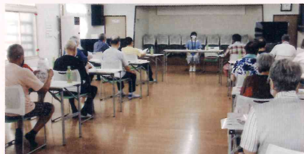
健康増進一日研修会 (ココロもカラダも健康に！)

四月十九日、三十四名出席の基で定期総会を開き、年間活動を決定しましたが、新型コロナウイルス感染症対策で、活動の自粛要請があり、観桜会・春の研修旅行・苺狩り等の行事は中止しました。この間、コロナワクチン接種の予約に苦慮しましたが、早期に完了出来ました。 感染対策を施しながら、毎月の定例会・五ヶ月の清掃美化運動を実施し、八月には「健康増進一日研修会」を開催、地域包括支援センターの講師から、「コロナ予防、健康体操の指導を受けました。(出席者二十五名)」 毎年実施される秋の交通安全旗波運動には、多数参加し、事故防止を呼びかけた。秋の研修旅行・忘年会の実施の他、今後も「新しい生活様式」を遵守、新年会、娯楽大会、軽スポーツ等を企画中です。気軽に参加をお待ちしております。