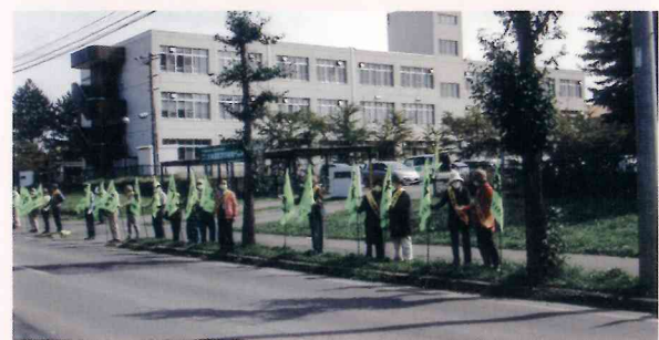
交通安全旗波運動参加 (交通安全・高齢者事故防止呼びかけ)