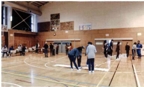
(ロコモ度と健康のチェック)