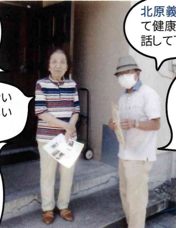
(7区南町内会のお二人です。)

書類の書き方を教えてもらったり、ごみ出しのお手伝いをしてもらったりしてありがたいと思います。