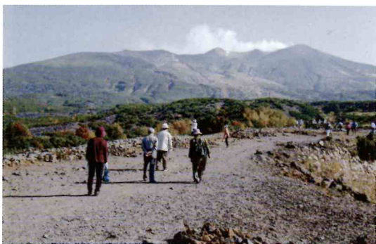
十勝岳望岳台にて紅葉を楽しむ

地域住民 募金活動 地域のツルハドラッグ店様に、共同募金箱設置のご協力をいただきました。募金額は（三、七九二円）でした。皆様、温かい募金をいただきました。ありがとうございました。