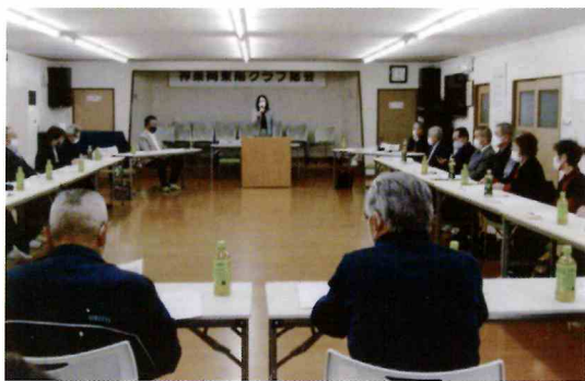
定期総会…「新しい生活様式」で活動します。