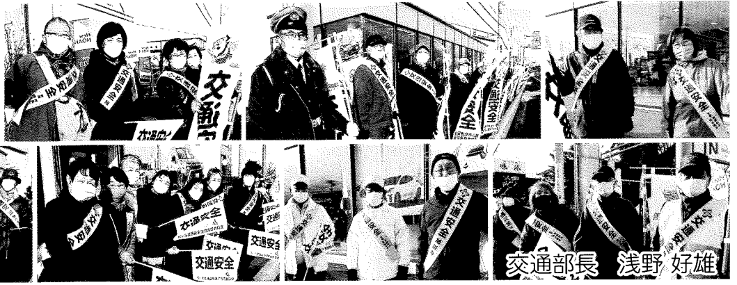
交通部長 浅野好雄