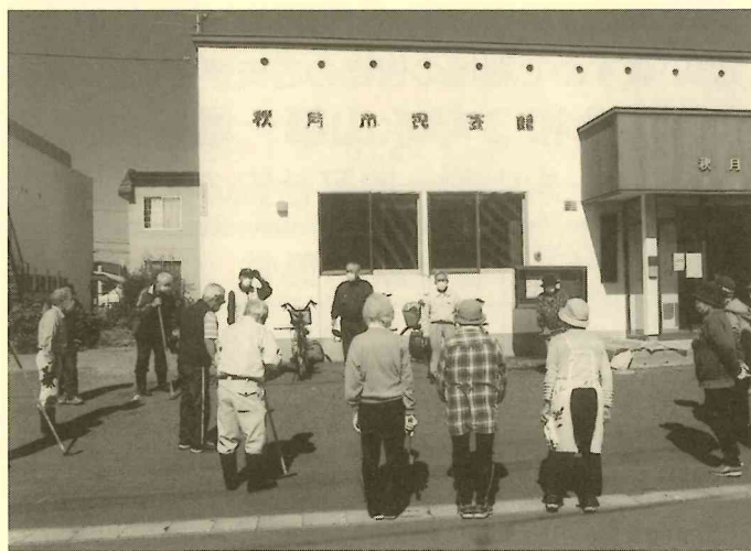
地域に奉仕活動として 清掃活動で汗をかく