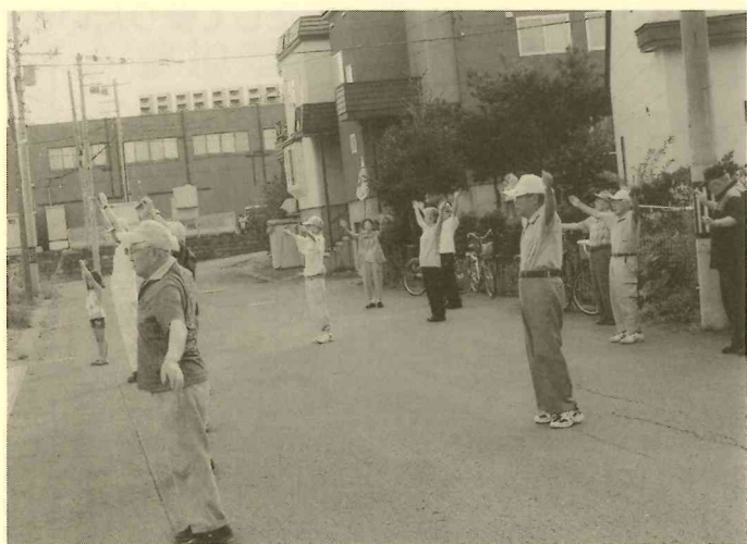
健康づくりのため 毎朝ラジオ体操