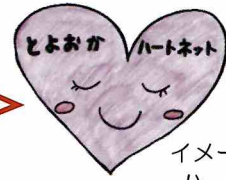
イメージキャラクター ハートネットちゃん

高齢化に伴い、認知症患者数は急増しています。65歳以上の高齢者3人に1人は認知症若しくはその予備軍とも言われている現在、「認知症」と聞いたら記憶が失われたり、人格が変わったり単純な計算や日常生活での動作が出来なくなり、やがては家族や自分が誰なのか分からなくなるこんなイメージがありませんか？決して大げさな表現ではありません。そこで早いうちに認知症予防を取り入れて行きませんか？