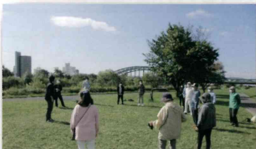
メモリアル病院理学療法士さんの指導のもと十分な準備体操