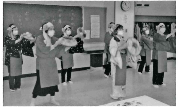
ボランティアによる 花笠音頭で大盛り上がり。