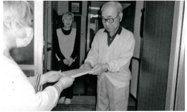
「ご長寿お目出度うございます！益々お元気で！」 「ありがとうございます」