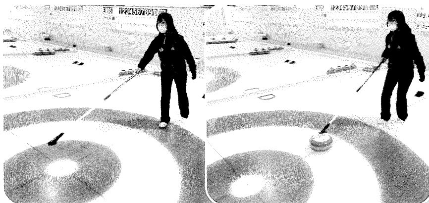
スティックカーリングの様子