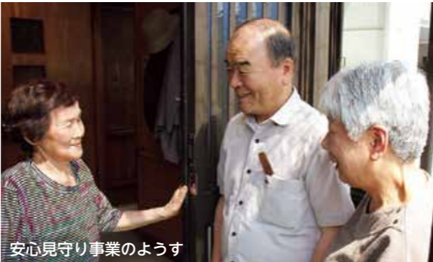
安心見守り事業のようす

【応募方法】はがき・FAX・メールにて 【必要事項】①ご意見・ご感想 ②住所 ③氏名 ④年齢 ⑤電話番号 【応募締切】令和元年8月30日(金)まで(当日消印有効) 【応募先】旭川市社会福祉協議会の5条事務所(下記参照)まで ※ご意見・ご感想で得た個人情報、プレゼントの抽選及び発送以外に使用しません。