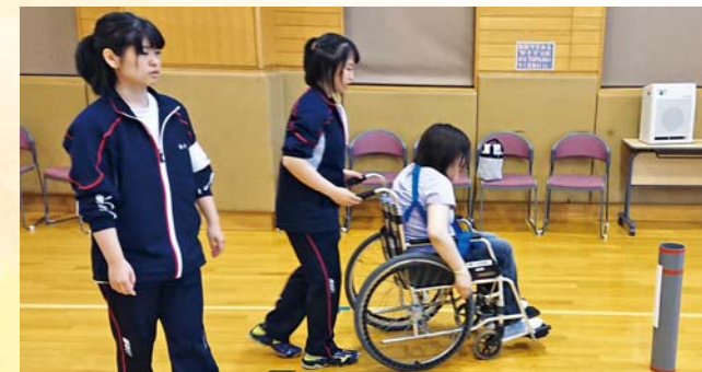
障害者スポーツフェスタでのボランティアの様子

また、今後の目標について「街頭募金などの活動が、『学生がんばっているなあ』と思ってもらうことで終わるのではなく、『一緒にボランティアをやってみよう』と思ってもらえるように、自分たちが楽しんでいる姿をみせたいと思います。ボランティア活動を通じて、私たちの思いを旭川から伝えていきたいです！」と語ってくれました。