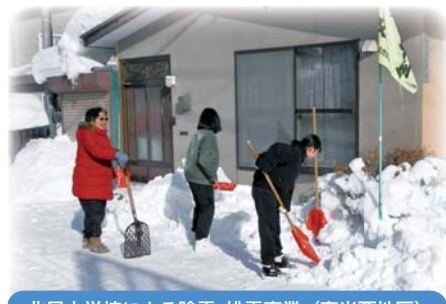
北星中学校による除雪・排雪事業 (春光西地区)