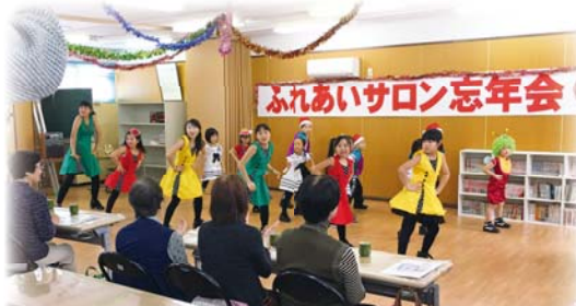
世代間交流ふれあいサロン忘年会 (愛宕地区)