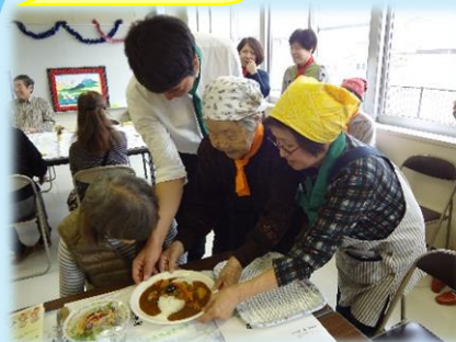
認知症の方との交流

旭川市社会福祉協議会 地域福祉課 旭川市生活支援 コーディネーター小山 電話：23-0742 FAX：23-0746