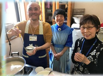
施設で甘酒づくり