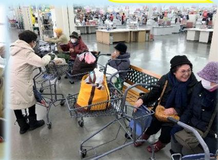
買いものを通じた交流