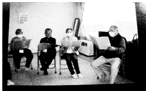
○合唱をして、喉を鍛えています