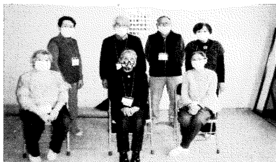
○ある日の参加者(コロナ禍から少ないです)