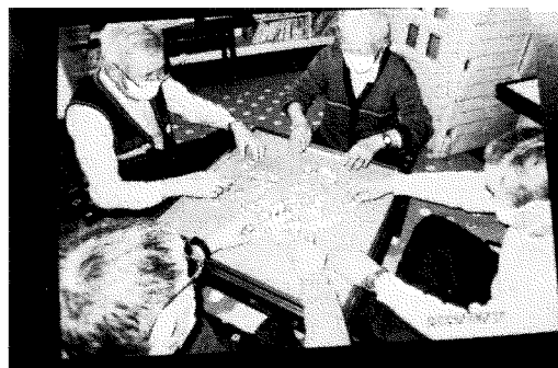
○認知症予防ゲーム?