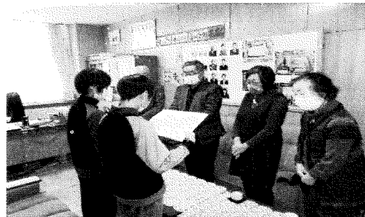
○岡小へ本贈呈によるお礼作文譲渡式