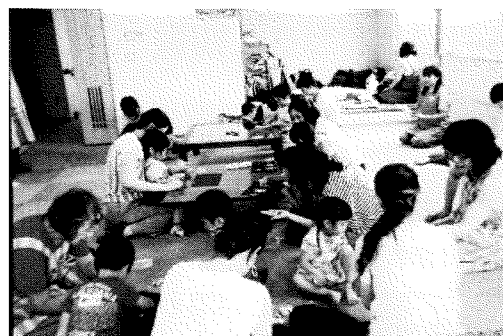
○お母さんと楽しい一時