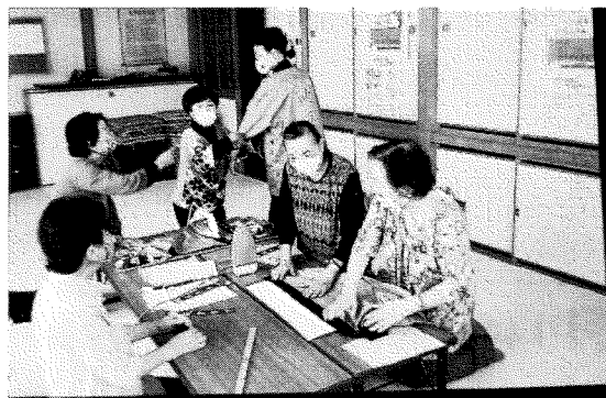
○イベント等にてのPR用「クラブ名織込み半纏」作成中