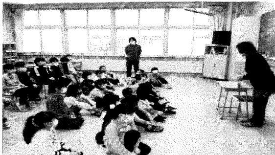
○クラブ会員の岡小児童へ絵本読み聞かせ会