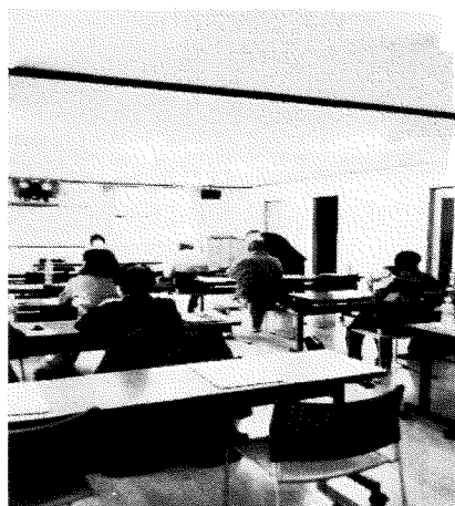
○研修会(認知症について)