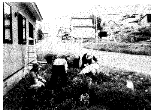
○神楽岡中央会館花畑除草

☆クラブ会員は随時募集しております。会費年1,500円その他、サークル活動費、別途懸る場合もありますのでご確認ください。