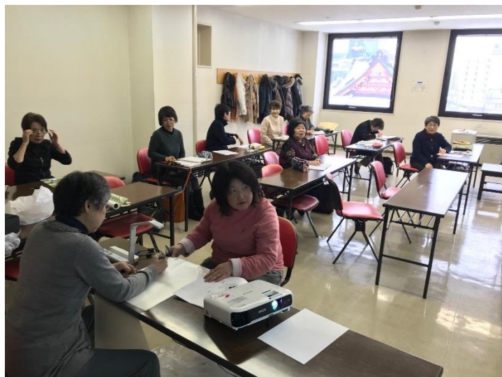
「ひまわり」の例会のようす

要約筆記サークル「ひまわり」では、要約筆記を通じて、中途難聴者の方が社会参加しやすいよう、行事等の開催支援や交流、市民への啓発活動を行っています。その活動は昨年30周年を迎えました。高齢化に伴い、耳の聞こえが悪くなることは私たちにも身近な問題です。ぜひ、皆さんも「ひまわり」の活動を通じて、改めて聴覚障害者の方の支援について考えてみませんか？