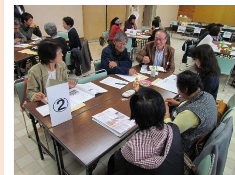
研修での意見交換

意見交換終了後、参加された方からは「講師からのお話やボランティア活動のことが聞いて良かった。楽しんで活動することが大事だと思う。」「いろいろなボランティア活動があることを知り、これから少しでもお手伝いが出来たらと思った。」などの感想を頂くことができました。研修会にご参加頂いた皆さん、ありがとうございました！